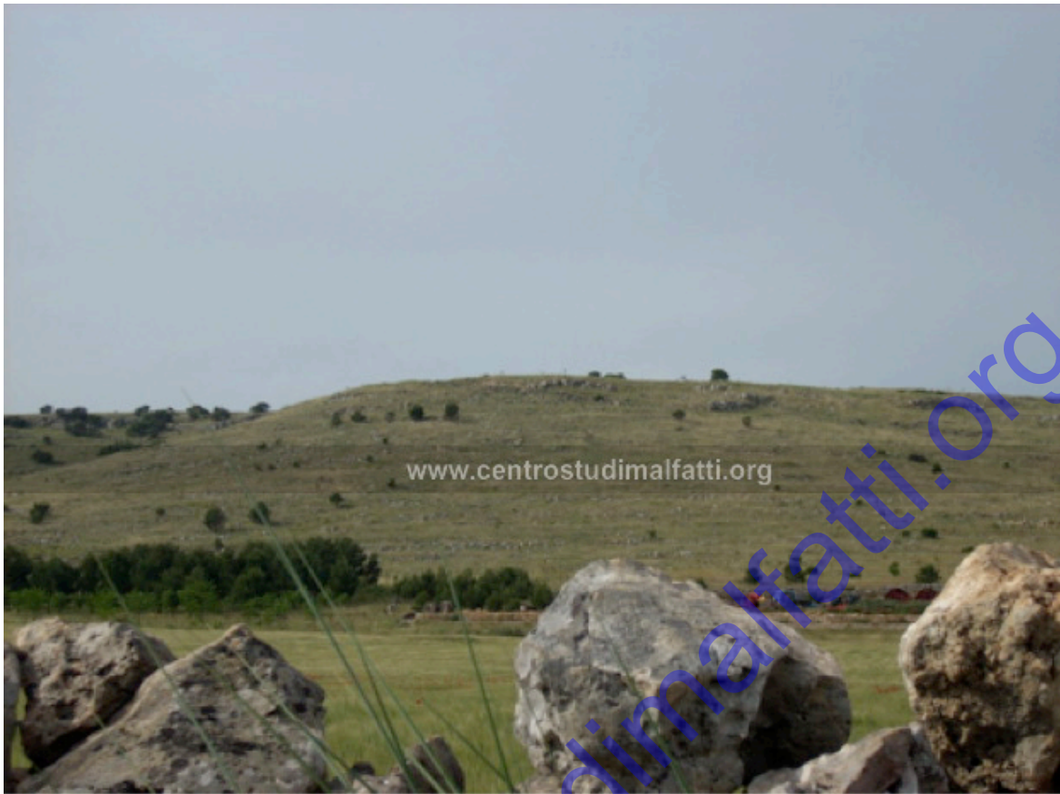
Nell'area circostante sono stati rinvenuti ceramiche di varie epoche.