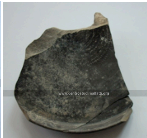
Particolare dell'interno del piatto