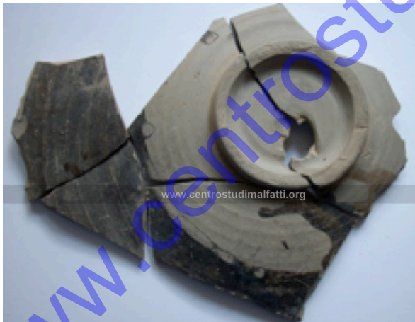
Frammenti di un piatto – località Morsara (Museo Archeologico di Altamura)